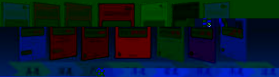
一体化课程教学设计 综合实践室